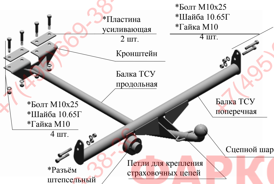
Рис.1 Тягово-сцепное устройство в сборе

Примечание: детали, помеченные * входят в пакет с комплектующими.